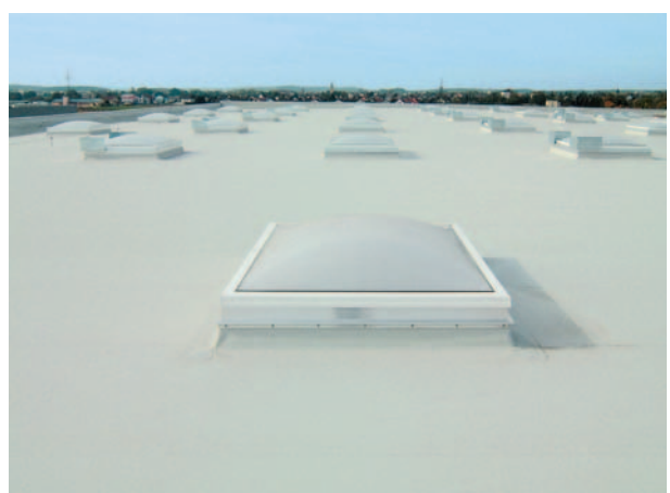
Schedetal SystemFlachdach in Nürnberg.