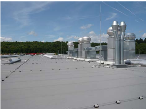
Schedetal SystemFlachdach in Stuttgart.