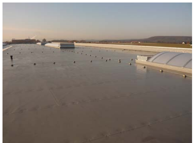
Schedetal SystemFlachdach in Filderstadt.