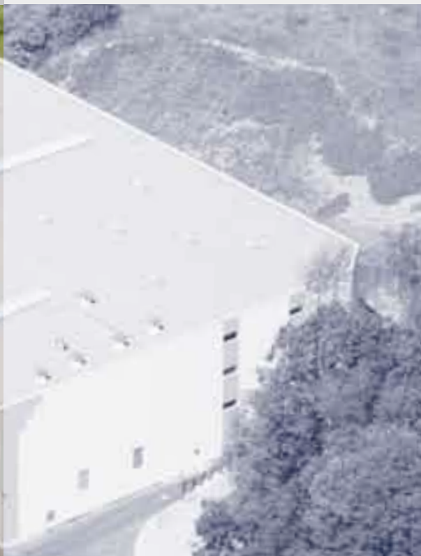
Фирма PUFAS в г. Ханн.Мюнден ExtruPol/Экструполь Изоляция крыши, 7.100 м 2